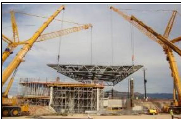
Vista ejecución de la cubierta