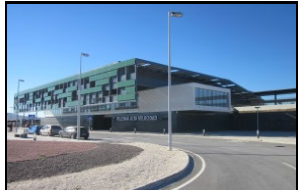
Vista Obra Finalizada