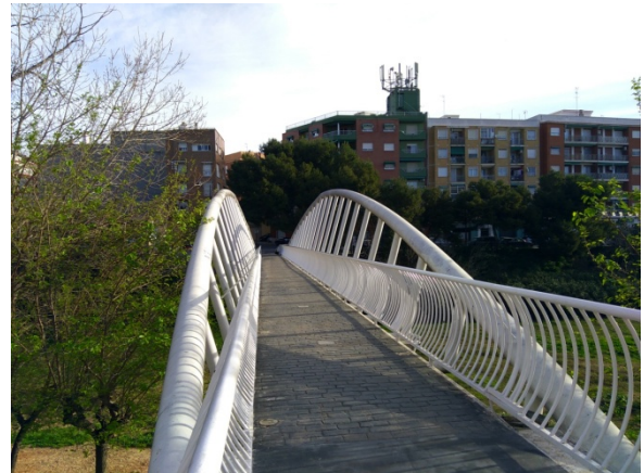
Elementos de estudio en un PMUS