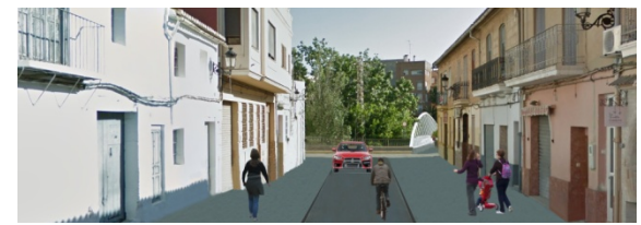
Antes / después en zona de prioridad peatonal y uso compartido vehículo-ciclista