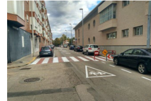
Sección propuesta / Itinerarios principales vehículos / Señalización escolar